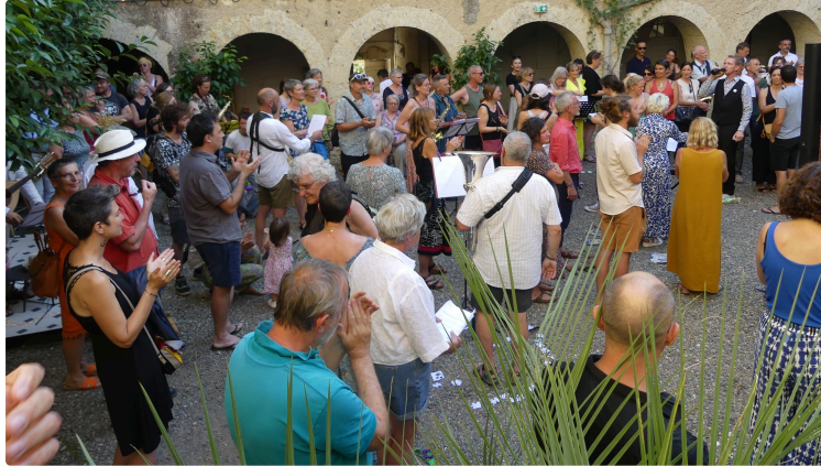
memento : le mercredi splendide avec Minimal St.Cecilia #6