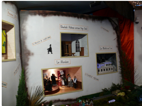
Sherlock Olmes, un détective excentrique.

Quelques 25 000 visiteurs sont attendus jusqu'au 10 janvier, jour où tombera le rideau sur cette 21e édition de la ronde des crèches en pays de Lomagne.