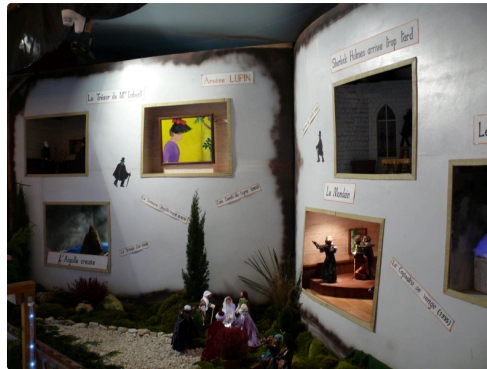
Arsène Lupin, un gentleman cambrioleur.