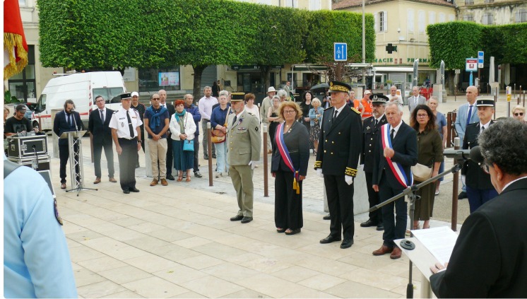
Hommage a été rendu aux victimes des crimes racistes et antisémites de l'État Français et aux Justes de France

La cérémonie en mémoire des victimes des crimes racistes et antisémites de l'État français et d'hommage aux "Justes de France" s'est déroulée dimanche 21 juillet en fin de matinée, place de la Libération, au bas des escaliers d'Etigny, où sont apposées les plaques souvenir.