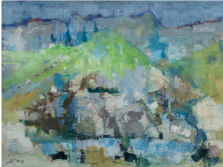
Exposition rétrospective du peintre Albert Lauzero à l'Abbaye de Flaran

Poursuivant le travail engagé autour de l'Art contemporain depuis plus de 23 ans, la Conservation départementale du Patrimoine et des musées/Flaran consacre toujours un temps de sa programmation estivale à l'accueil d'un(e) artiste, révélateur(trice) des recherches esthétiques de l'Art de notre époque.