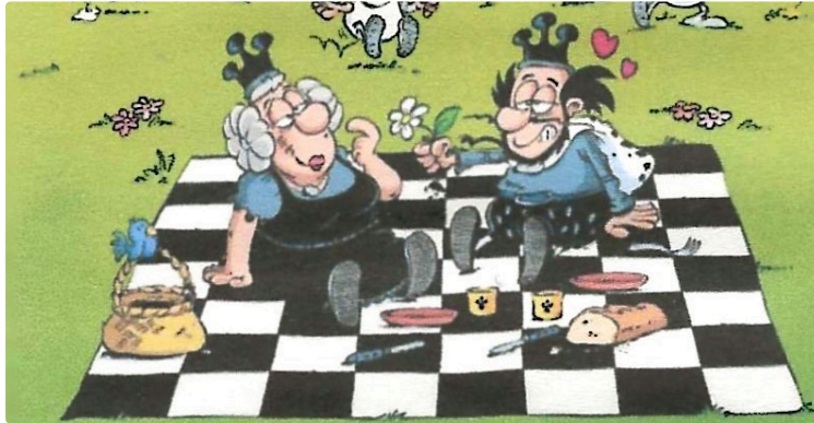
Philajeune au salon de la BD

Une année de plus ! 21, 22, sans doute 23 ans que Philajeune est présent au Salon BD en Gascogne à Eauze.