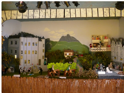
Vue d'ensemble de la crèche.

Quelques 25 000 visiteurs sont attendus jusqu'au 10 janvier, jour où tombera le rideau sur cette 21e édition de la ronde des crèches en pays de Lomagne.