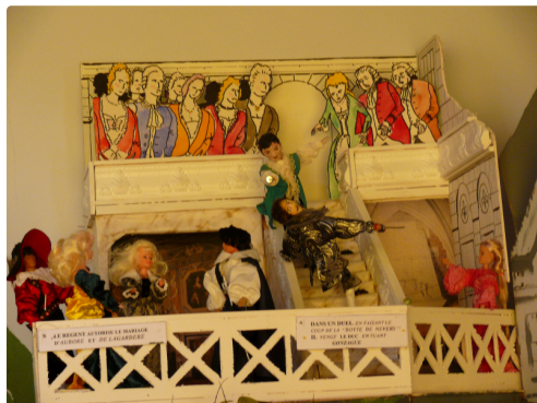
Le Régent autorise le mariage d'Aurore et Lagardère. Dans un duel en faisant le coup de la "Botte de Nevers" il venge le Duc en tuant Gonzague.