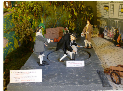
Lagardère revient à Paris et se déguise en bossu. Il retrouve l'assassin du duc de Nevers, c'est ... Gonzague !