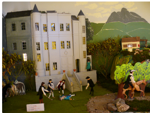
Le duc de Nevers est assassiné, Gonzague est blessé à la main, Lagardère sauve Aurore.