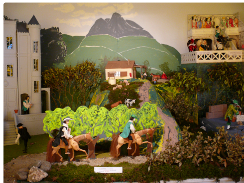
Lagardère et Aurore s'exilent en Espagne pendant 18 ans.