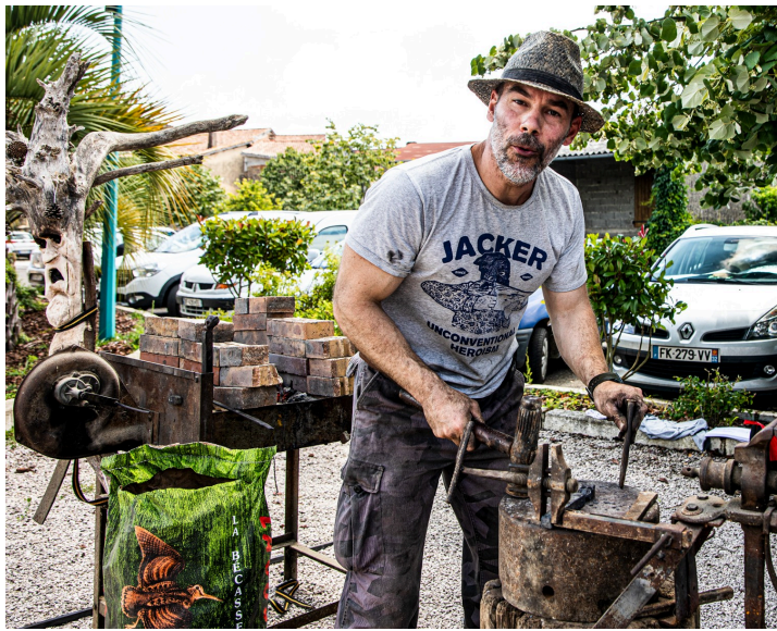
Forgeron aux Artistes dans la rue