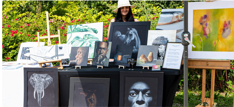
« Les Artistes dans la rue » à Aignan, c'est le 20 juillet 2024

Art et artisanat d'art présenté par la Chrysalide