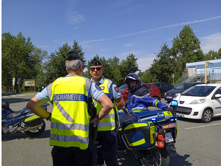
Opération "carton jaune"

Le 5 juillet avait lieu au point d'animation du lac à l'Isle-Jourdain un contrôle routier "opération carton jaune" menée par un groupe départemental de gendarmes. Lors de leur prise de parole avec les relais de presse et radios départementales, leurs responsables de terrain ont bien expliqué le but. C'est la quatrième opération menée sur le département, le contact est porteur, les conducteurs arrêtés suivent les recommandations des représentants du service et écoutent les informations, les suivent au sein des locaux de l'office du tourisme prêtés à cet effet. Là des intervenants montrent et précisent le bon à savoir des photos et illustrations. Une opération qui suscite l'intérêt et dont il faut signaler la mise en œuvre. Merci aux acteurs de cette opération pour leur sympathie et leur partage d'informations, à renouveler.