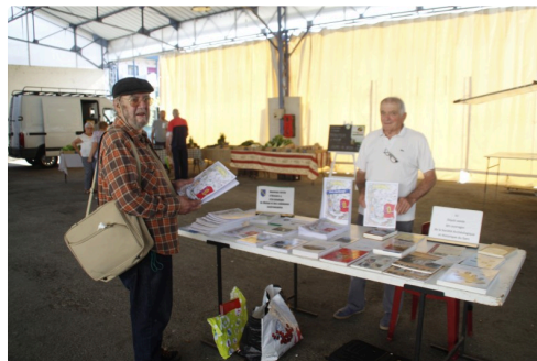
Recueil N°20 11072024 (6).JPG