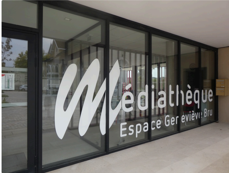
Les mois d'été à la Médiathèque