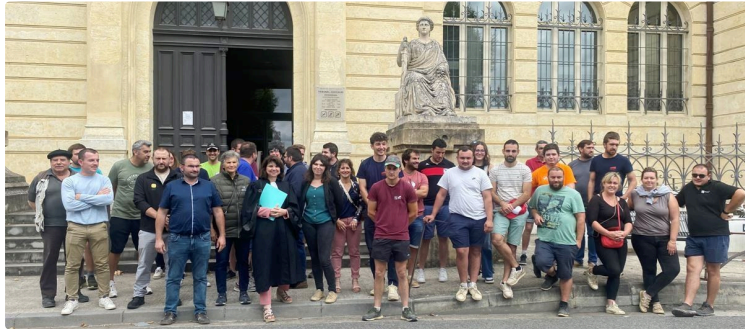
Affaire classée sans suite pour la syndicaliste co-présidente des JA de Condom et Valence

Il manquait tout simplement des preuves des dégradations