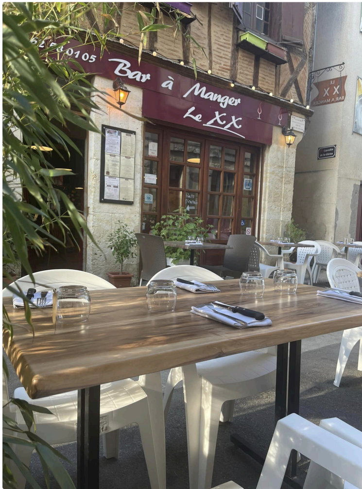
Tables du Gers : programme des animations de l'été

Cet été, les Tables du Gers vont sublimer les produits locaux sur l'ensemble du territoire.