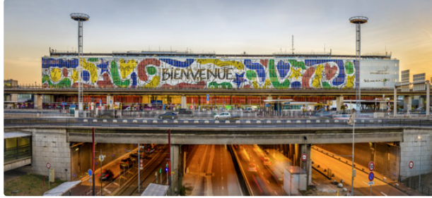
Jean-Charles de Castelbajac