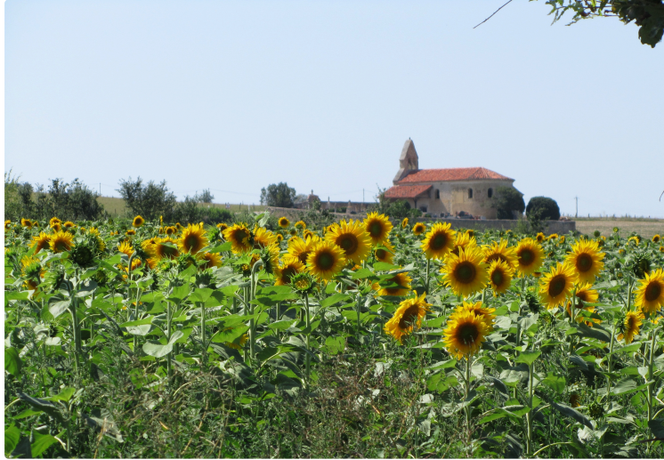
Venez découvrir les orchidées sauvages à la chapelle de Las !

Comme chaque été, l'ASEL (Association pour la Sauvegarde de la Chapelle de Las ) organise plusieurs événements culturels au profit de la chapelle.