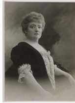
Augusta HOLMES 1847-1903