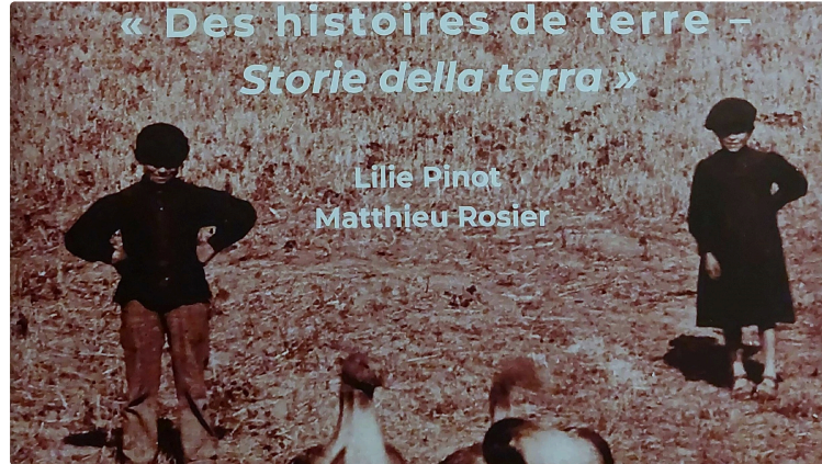
Exposition "Des histoires de terre- Storie della terra"