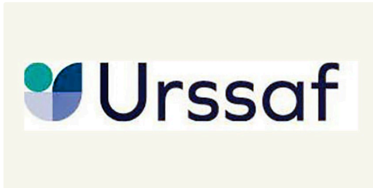
Emploi en Occitanie : accroissement significatif pour le 1er trimestre 2024