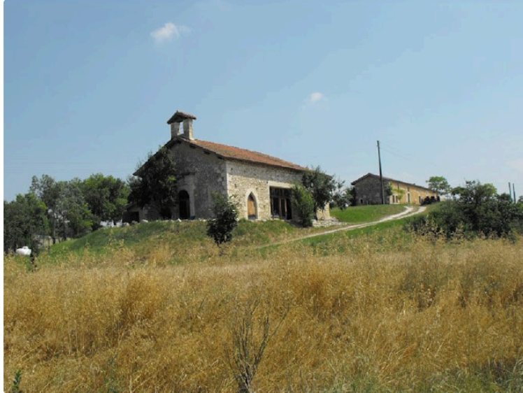
Petite Pierre : deux spectacles en ce début d'été

Deux rendez-vous spectacle à noter dans vos agendas en ce début juillet à La Petite Pierre !