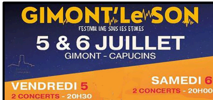
Gimont du son et du bon les 5 et 6 juillet