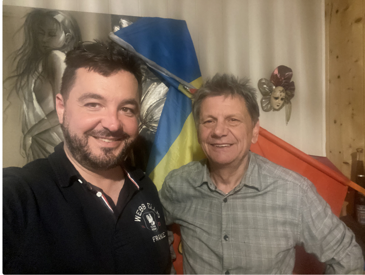
Le Gers est une terre occitane riche de sa culture millénaire