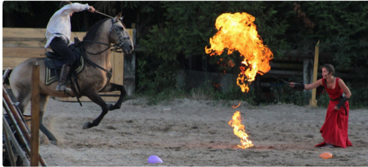
Encore un moment festif exceptionnel

Les fêtes de la Saint Pierre 3 jours XXL