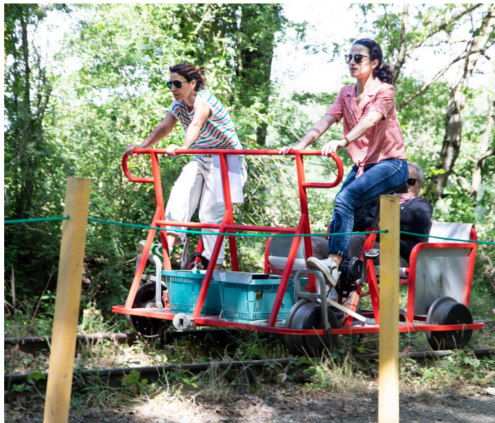
Une autre arrivée en douceur au terre-plein