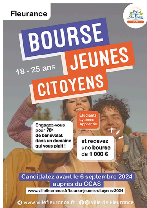
fleurance bourse jeune affiche .jpg

Pour candidater, adressez votre lettre de motivation au CCAS avant le 6 septembre en précisant vos motivations ainsi que les domaines dans lesquels vous souhaitez effectuer votre mission citoyenne (solidarité, enfance, senior, CCAS...) : ccas@villefleurance.fr