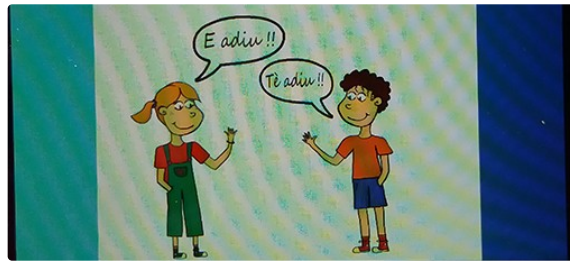
conférence du cercle gascon de négocis

Le cercle gascon de négocis organise une conférence sur la langue gasconne le 23 juin 2024 à 18heures, à Castera-Verduzan, salle de la mairie.