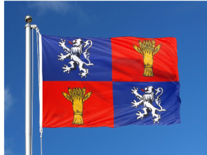
Semaine Mondiale de la Gascogne : tout le programme !

Initiée par l'association Le Cercle Gascon de Negocis (CGN), la Semaine Mondiale de la Gascogne va se dérouler