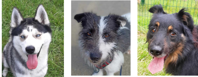
Les trois jeunes chiens de la semaine, Ulys, Mailou et Rex !

Cette semaine, la SPA vous présente trois loulous tous les trois arrivés au refuge en mai dernier.