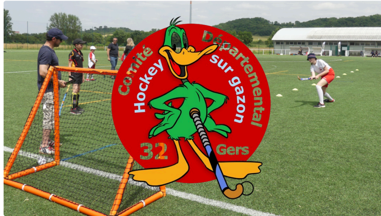
Grande fête du hockey gersois

Dimanche dernier le comité gersois et l'Auch Hockey Club organisaient la grande journée du Hockey sur gazon sur le terrain du Pitous à Auch. Le Gers compte trois clubs : L'Isle-Jourdain Hockey-Club (créé il y a 17 ans), le Hockey-Club de la Save (Lombez-Samatan) et le ASPTT Auch Gers Hockey.