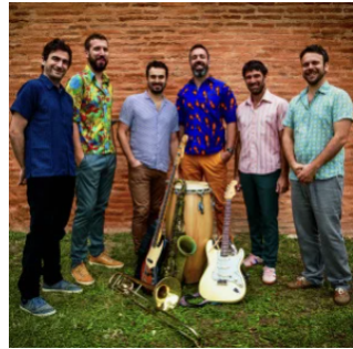
Le Tout Puissant Tropical Orchestra