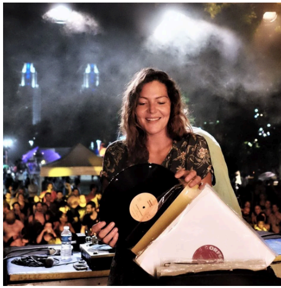
Dj Mambo Chick