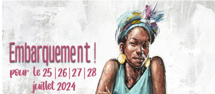
Tempo Latino présente... Dimanche 28 juillet 2024 ; America Latina, Viva !