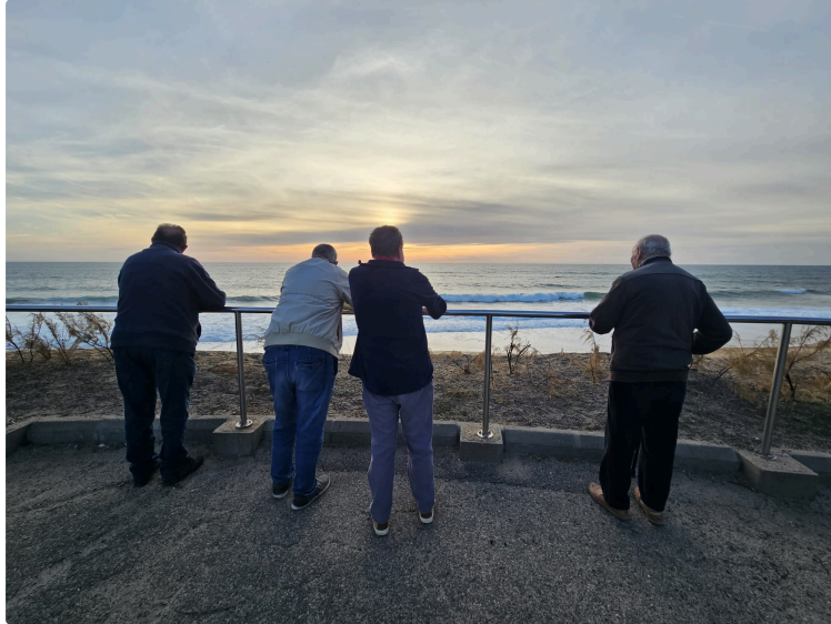
Quand les résidents de l'EHPAD de l'hôpital partent au bord de l'Océan...

La fin du mois de mai était synonyme de vacances pour quelques résidents de l'EHPAD de Vic-Fezensac, des vacances au bord de la mer !