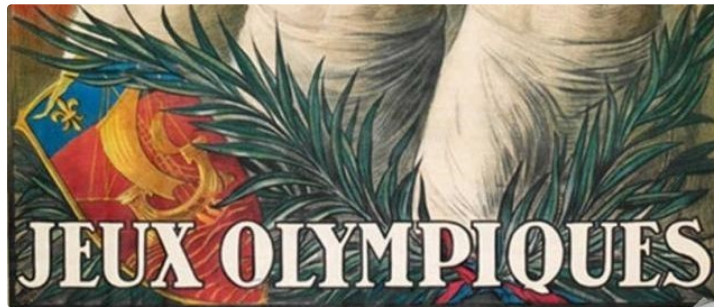
La Floureto, Jeux olympiques 1924