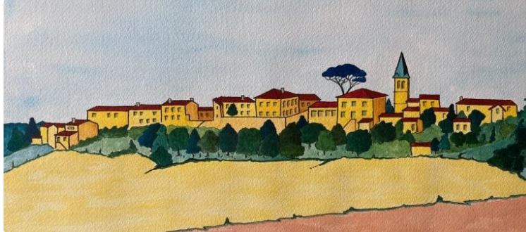
Cimaise Armagnacaise : réservez votre début août à Roques !

L'association La Cimaise Armagnacaise a finalisé ses animations pour la première semaine d'août à Roques (32310).