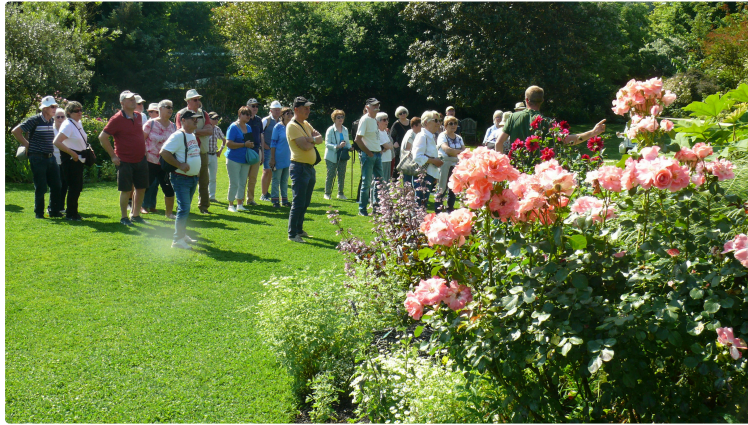
Journée de découverte en Ténarèze

La Romieu avec Coursiana, Castelnaud-sur-l'Auvignon, le village martyr, et Condom, le centre ville, ont été visités