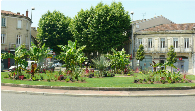
Espaces verts, Fleurs sur la ville

A l'approche de l'été, la décoration florale est entièrement renouvelée par les jardiniers municipaux qui ne laissent rien au hasard pour donner naissance à des ensembles harmonieux et multicolores.