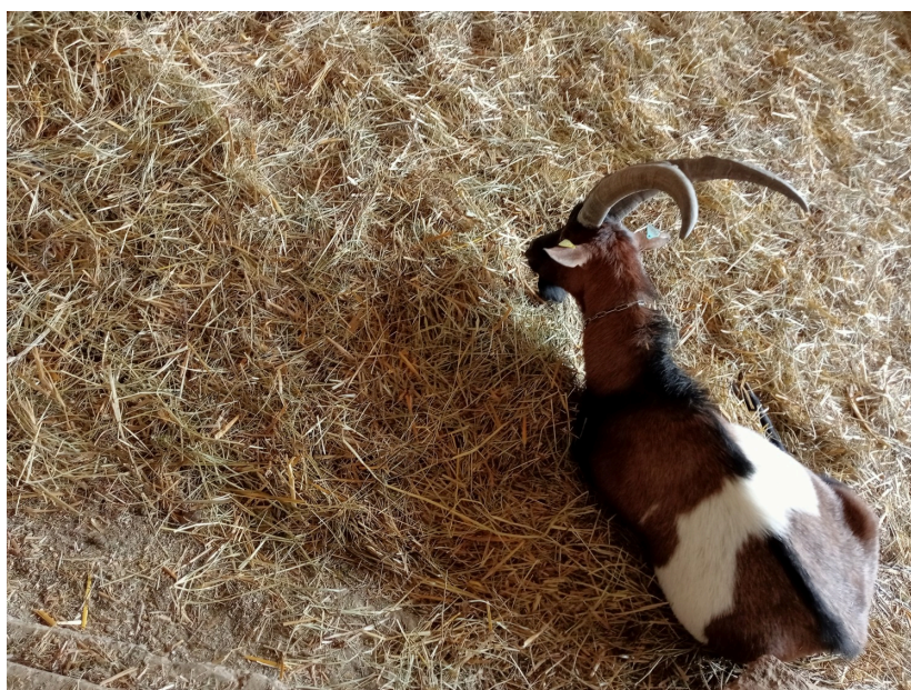
Pause digestion pour l'un des deux boucs du troupeau

Tous les animaux sont nés sur la ferme sauf les boucs achetés à l'extérieur afin d'éviter la consanguinité.