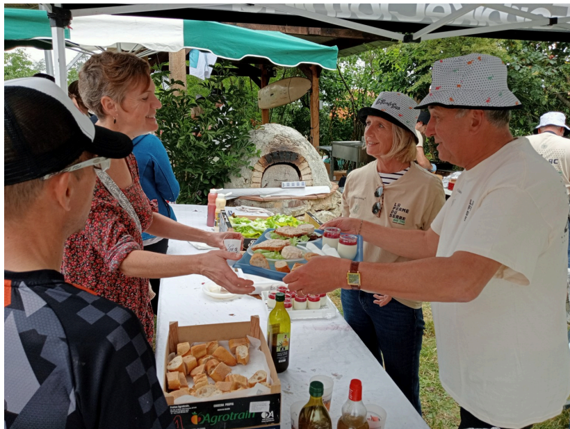
Sourires partagés : plateau de chèvre frais