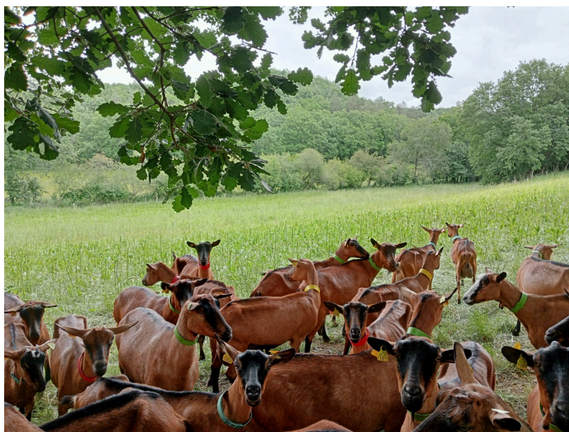
Une chèvre "alpine" qui s'adapte bien au terroir gersois

Sur les 38 hectares de parcelles, un bon tiers est boisé le reste étant des prairies pâturées ou fauchées. "Les prairies sont ressemées régulièrement afin d'avoir un stock renouvelable de légumineuses et de bonnes protéines pour la production de lait."