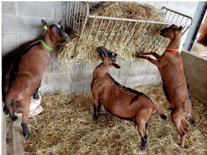
Du fourrage toute l'année pour ces dames