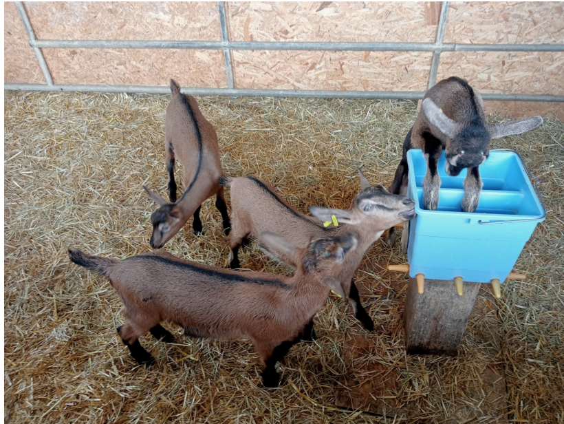
Les plaisirs du biberon