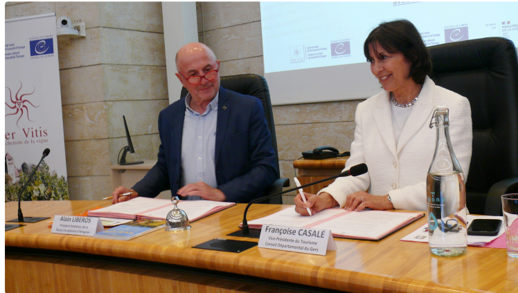
Le Département du Gers conforte ses liens touristiques et culturels autour de "La route européenne d'Artagnan"

Dans l'hémicycle du Conseil Départemental le 30 mai a été signée une convention de partenariat sur la mise en tourisme et la valorisation de la Route Européenne d'Artagnan dans le Gers. Cette convention a été paraphée par le Conseil Départemental, l'association européenne de la route d'Artagnan, AREA, et le Comité départemental du tourisme destination Gers. L'objet était de valider les modalités de partenariat entre les trois signataires pour contribuer au déploiement de AREA sur le territoire du Gers, sa mise en tourisme et sa valorisation culturelle en coopération étroite avec les collectivités infra-départementales (Communautés de communes, d'agglomération, Communes, les offices de tourisme) et les partenaires.