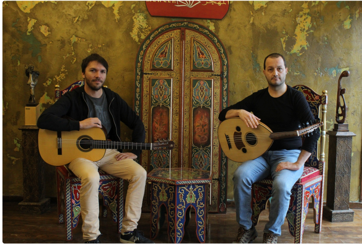
Le café de la Paix propose un concert vendredi 7 juin, à 19 heures.

"Au fil des cordes" un métissage harmonique.