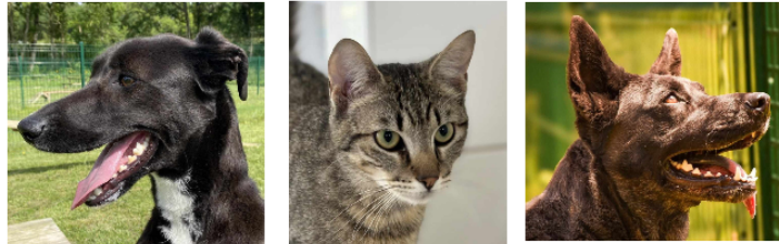
Deux jeunes chiennes et un matou à la une cette semaine

Cette semaine, la SPA vous présente deux nouvelles arrivées au refuge, les jeunes Taya et Imera, et un matou.