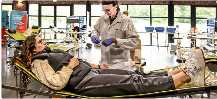
89 personnes ont donné leur sang à Nogaro

La collecte de sang organisée par l'Établissement français du sang (EFS) et l'association Don du sang Nogaro Aignan (DSNA) le 27 mai 2024 est un succès : 89 personnes sont venues donner leur sang, dont 8 nouveaux donneurs.