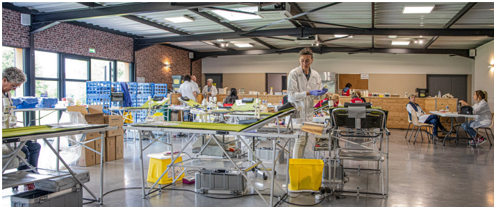
La salle est prête à recevoir les donneurs

La collecte de sang organisée par l'Établissement français du sang (EFS) et l'association Don du sang Nogaro Aignan (DSNA) le 27 mai 2024 est un succès : 89 personnes sont venues donner leur sang, dont 8 nouveaux donneurs.