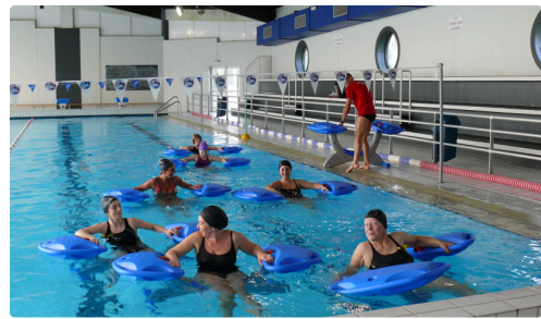
Un moment de détente avant de reprendre les exercices.

Cette activité sera proposée à partir du 6 janvier le mercredi à 8 heures et 11 heures et le samedi à 11 heures. Tarif : 5 euros la séance, entrée comprise. Il est prudent d'appeler la piscine au 05 62 61 21 32 pour s'assurer de la disponibilité des places car dix vélos sont seulement disponibles.