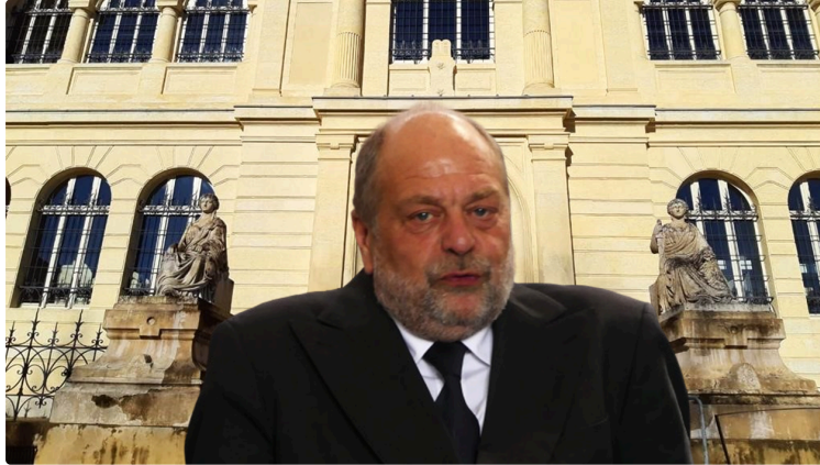
Le Garde des Sceaux, ministre de la Justice en visite à Auch

Éric Dupond-Moretti , garde des Sceaux, ministre de la Justice était cette fin de semaine en visite ministérielle à Auch pour participer à une table ronde au tribunal sur la justice de proximité, une autre rencontre à la gendarmerie avec les associations d'aide aux victimes d'agressions, et pour terminer la journée à titre privé au centre Cuzin pour soutenir la liste " Besoin d'Europe " concernant la campagne des européennes.