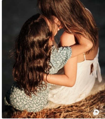
L'Été photographique de Lectoure," l'événement de la saison"

Pour rappel, cette 35ème édition du festival se déroulera du 20 juillet au 29 septembre 2024, dans plusieurs lieux patrimoniaux de Lectoure, présentant près d'une quinzaine d'artistes et avec de nombreux événements et animations culturelles.