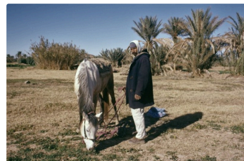
l'homme et le cheval.jpg