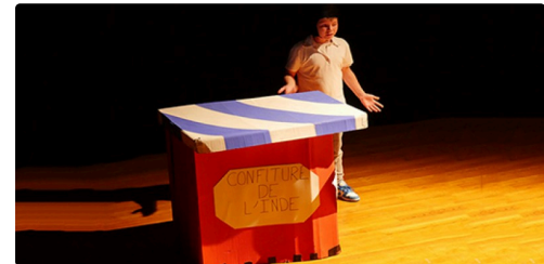
fleurance spectacle enfants jo (7).jpg