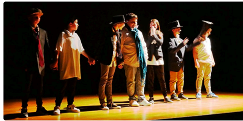
fleurance spectacle enfants jo (3).jpg