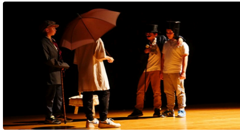
fleurance spectacle enfants jo (2).jpg

Tous ont pleinement profité de cette pièce amusante et dynamique : les artistes ont été chaleureusement applaudis en fin de représentation