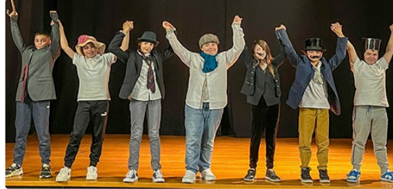
"Guignol et le pot de confiture"

Les 16 et 17 mai, 7 élèves de CM2 (Ulis - École Louis Monge) ont présenté leur pièce de théâtre "Guignol et le pot de confiture", qu'ils travaillaient depuis le mois de janvier avec leur enseignant.