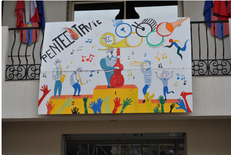
Pentecôtavic 2024 : clap de fin avec la journée des familles

Traditionnellement, le lundi de Pentecôte est consacré aux familles.