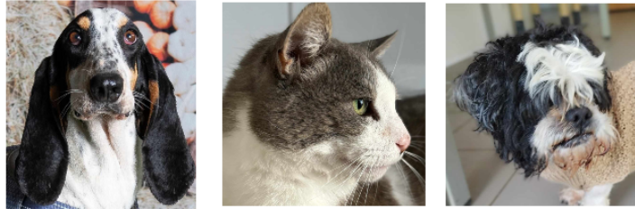
Deux adoptions SOS et un matou cette semaine

Cette semaine, la SPA vous présente Gaston le matou et deux adoptions SOS, Dyna, la mascotte de la SPA, arrivée en 2021 et Isac, un papi.