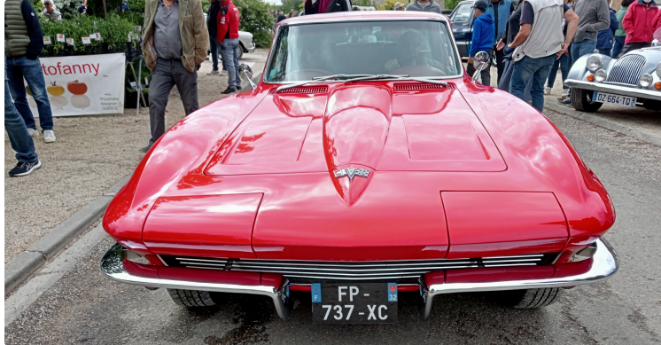
Les belles cylindrées de Maignaut-Tauzia

Après un détour ornithologique, retour aux voitures de collection pour Pierre Forêt qui revient pour Le Journal du Gers sur le lundi de Pentecôte à Maignaut-Tauzia.