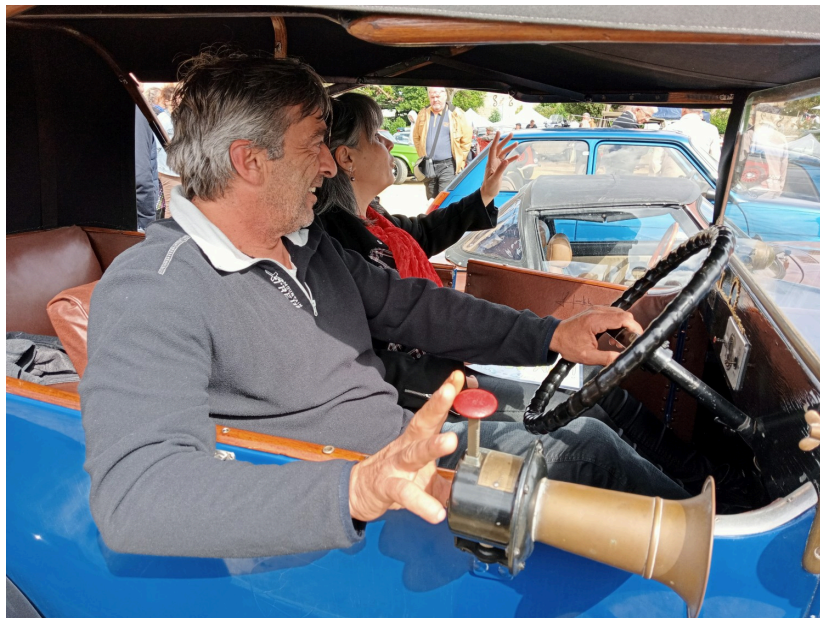
Un tacot nommé désir

S'il est vrai que seulement 12 modèles ont été construits au début du XIX ème siècle, cette cylindrée de 1550 cm 3 a tout pour plaire surtout dans les vallons gersois : une consommation de 5 L au 100 en campagne pour une vitesse de croisière de 70km/h . Parfait pour nos chemins ruraux .