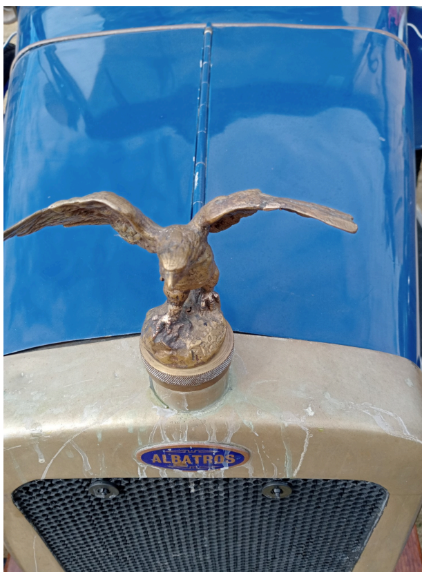
La marque d'un géant des mers

S'il est vrai que seulement 12 modèles ont été construits au début du XIX ème siècle, cette cylindrée de 1550 cm 3 a tout pour plaire surtout dans les vallons gersois : une consommation de 5 L au 100 en campagne pour une vitesse de croisière de 70km/h . Parfait pour nos chemins ruraux .