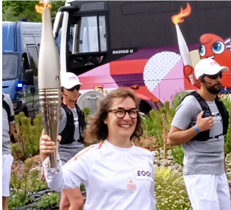
Accueil de la flamme olympique: plus de 15 000 spectateurs !