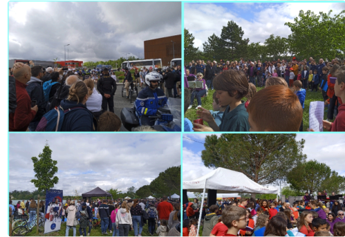
jlk - Copie.png