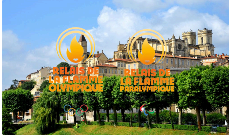
Auch a la flamme pour les jeux !

Après le tour du Gers pour la flamme, l'apothéose, c'est donc le tour d'Auch. Après un départ place de la cathédrale un peu avant l'heure prévue (vu sur l'article précédent) nous retrouvons la flamme Conseil Départemental avec peu de monde devant l'Hôtel départemental. En fait le public très nombreux se retrouve place de la cathédrale au départ et au parking du Mouzon pour l'arrivée.