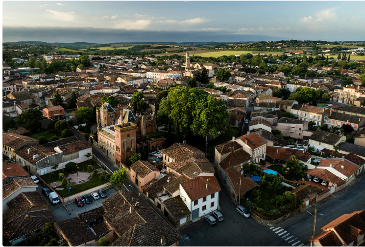
Flamme Olympique à L'Isle-Jourdain : Marché de plein vent, Circulation et stationnement...

L'Isle-Jourdain accueille le passage du relais de la Flamme Olympique samedi 18 mai 2024.