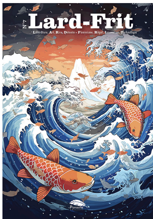
N°7 de Lard-Frit