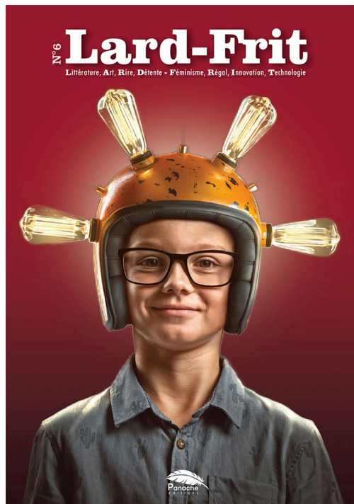
N°6 de Lard-Frit