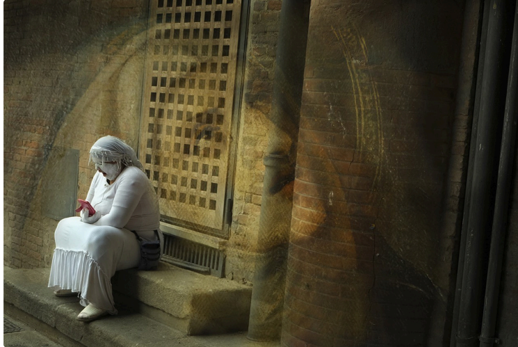
Vernissage au Domaine de Herrebouc de l' exposition photos du collectif Vertige « Au-delà des frontières : Bologna »

Vernissage au Domaine de Herrebouc en partenariat avec l'association auscitaine Bruits d'Couloir