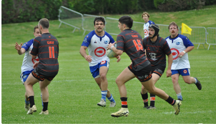
UAV Rugby : en route vers les 16e !

Dimanche, Vic l'a emporté 33 à 24 face à Bidart en 32e de finale challenge de France.